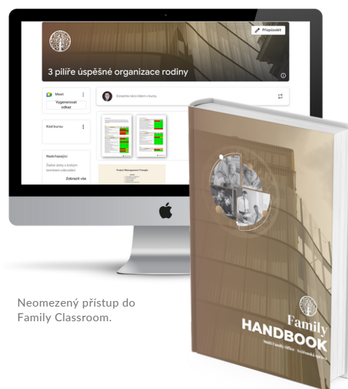
Neomezený přístup do Family Classroom.

Rodinná facilitace Profil rodiny 360° SWOT analýza rodiny