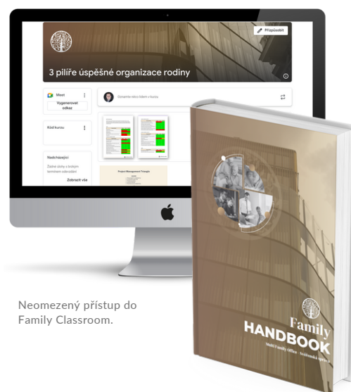
Neomezený přístup do Family Classroom.

V případě zájmu o tento program nebo více informací nás kontaktujte.