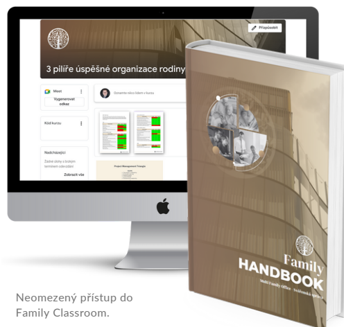
Neomezený přístup do Family Classroom.

V případě zájmu o tento program nebo více informací nás kontaktujte.