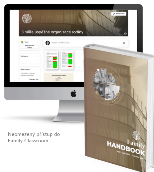
Neomezený přístup do Family Classroom.

Zkušenostně - reflexní učení Sdílení ve skupině Reflexe a zpětné vazby Individuální úkoly Facilitace